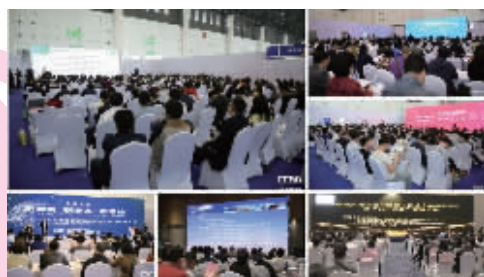
19届展会论坛活动现场

同时展览同期还将在9号多功能馆设立灯饰照明、陶瓷卫浴等20余场不同专题的行业活动, 包括新品发布、高峰论坛、培训会、颁奖典礼、作品展示、商务配对等多种形式的活动。